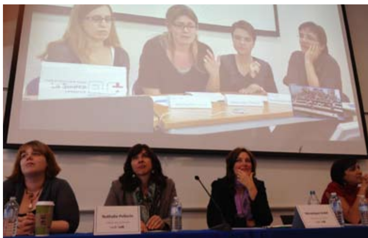
Étudiantes du Québec et de la Suisse en visioconférence - Colloque Alice Girard