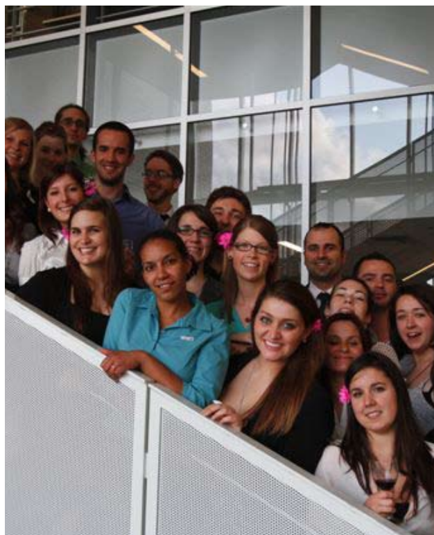
Finissants - année 2012