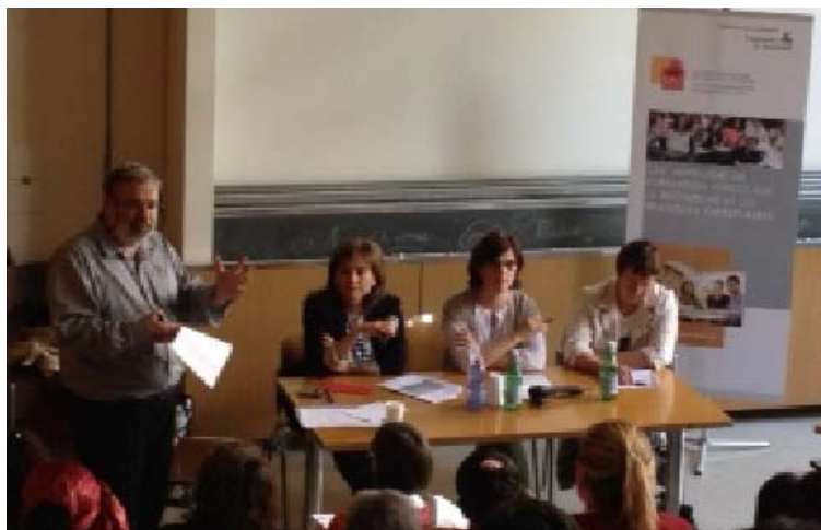
Atelier du CIFI au 5 e Congrès mondial du SIDIIIEF