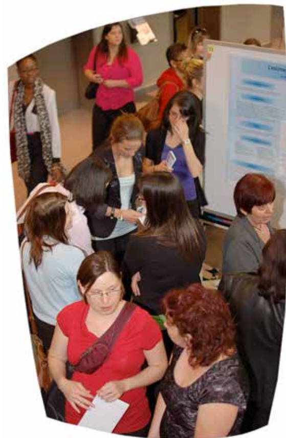
Les présentations par affiche dans le cadre du dernier colloque Alice-Girard au campus de Laval