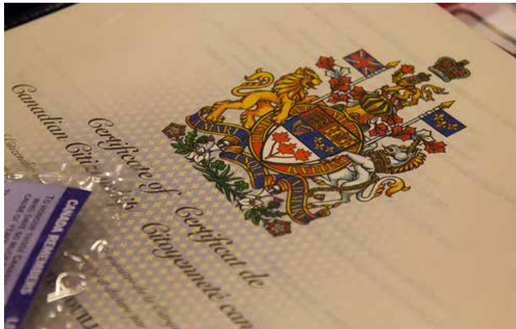
Mme Cécile Lechat, TCTB, a reçu son certificat de citoyenneté canadienne lors d'une cérémonie tenue le 22 mai en présence de collègues de la Faculté.