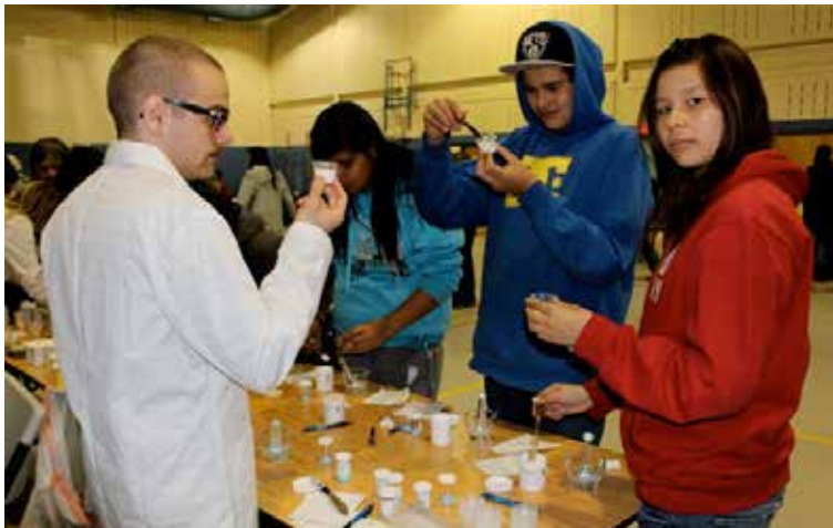
La Mini-école de santé, un projet bien accueilli par la communauté de Manawan