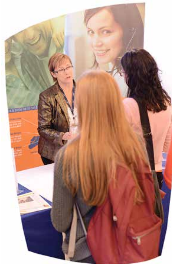
Le Salon de l'emploi, une activité de réseautage appréciée des étudiants et de nos partenaires