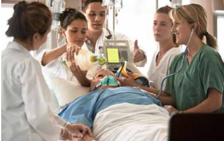
La formation en laboratoire

L'année 2014 marquant le 10 e anniversaire du programme de baccalauréat en sciences infirmières basé sur l'approche par compétences, des travaux ont été entrepris au cours des derniers mois pour réviser, mettre à jour et consolider le référentiel des compétences. Ceci comporte, entre autres, un examen approfondi des indicateurs utilisés pour évaluer la progression du développement des compétences tout au long de la formation. De plus, il s'agit de tirer profit de l'expérience acquise au cours des 10 dernières années pour faire le bilan des différentes stratégies pédagogiques qui se sont avérées particulièrement propices aux apprentissages des étudiants. La mise à jour de ce référentiel devrait donc être disponible en 2014 : avis aux personnes intéressées!