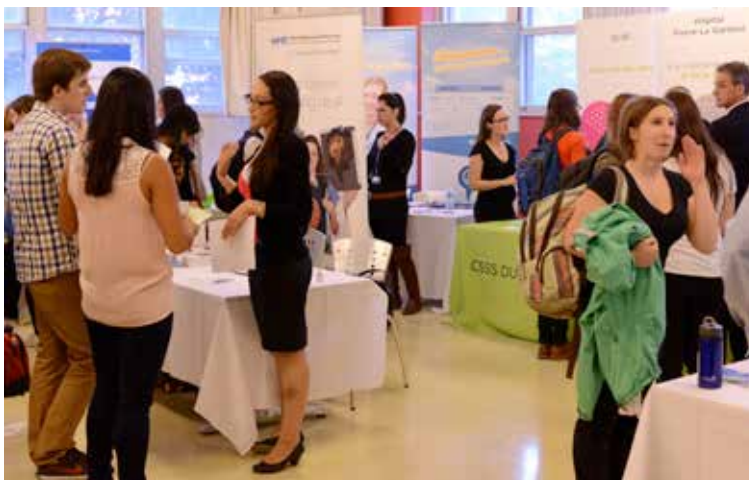
Le Salon de l'emploi 2013

Les commentaires et le niveau de participation témoignent de la pertinence d'un tel événement. Le défi du Salon de l'emploi de l'an prochain sera de composer avec