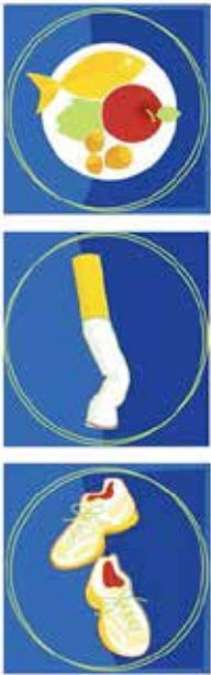
TAVIE en santé™