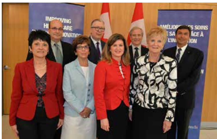
La ministre fédérale Rona Ambrose et les membres du Groupe consultatif

Au plan politique, la Faculté se fait de plus en plus présente dans divers comités. Notamment, un de nos professeurs a participé aux auditions de la Commission parlementaire de la santé et des services sociaux portant sur le projet de loi n°10. De mon côté, je poursuis mon engagement au Groupe consultatif fédéral sur l'innovation en soins de santé et ma participation à des rencontres avec le ministère de la Santé et des Services sociaux (MSSS) et le