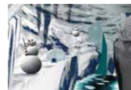
Un écran de l'application Snowman