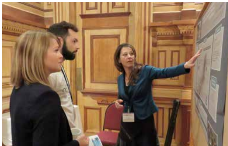
L'une des affiches présentée