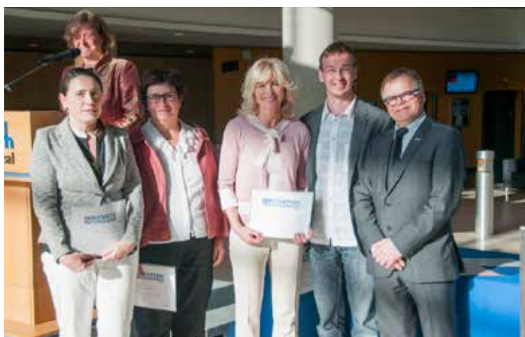
L'équipe du projet d'infirmière virtuelle à la soirée Bravo à nos chercheurs!

l'atteinte d'orientations et d'objectifs communs. Plusieurs de ses compétences ont en effet contribué au développement de la FSI pendant les dernières années : sa vision, la qualité de son écoute, sa grande maîtrise des dossiers, son accompagnement dans les tâches déléguées, la défense des priorités facultaires et celles de la profession auprès des décideurs en sont quelques exemples.