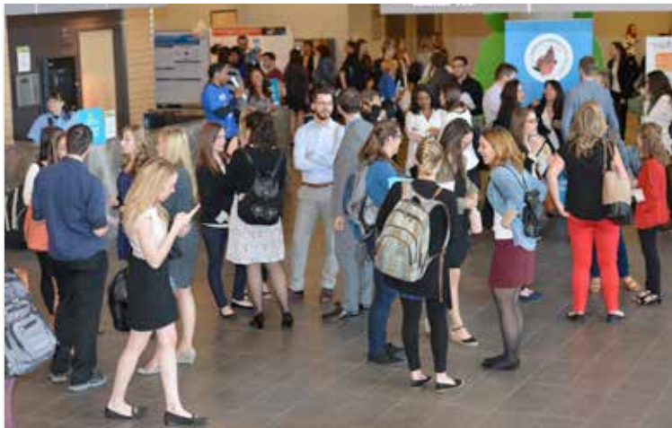
Des étudiants à l'édition 2015 du Colloque Alice-Girard

Le secteur préclinique a, encore une fois, innové en offrant un atelier portant sur