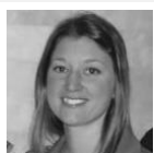
TABLE RONDE | MON PROJET DE RECHERCHE CLINIQUE EN 180 SECONDES

LA COLLABORATION INTERPROFESSIONNELLE LORS DE LA PRISE EN CHARGE D'UN POLYTRAUMATISÉ À L'URGENCE : UN ENJEU DE QUALITÉ